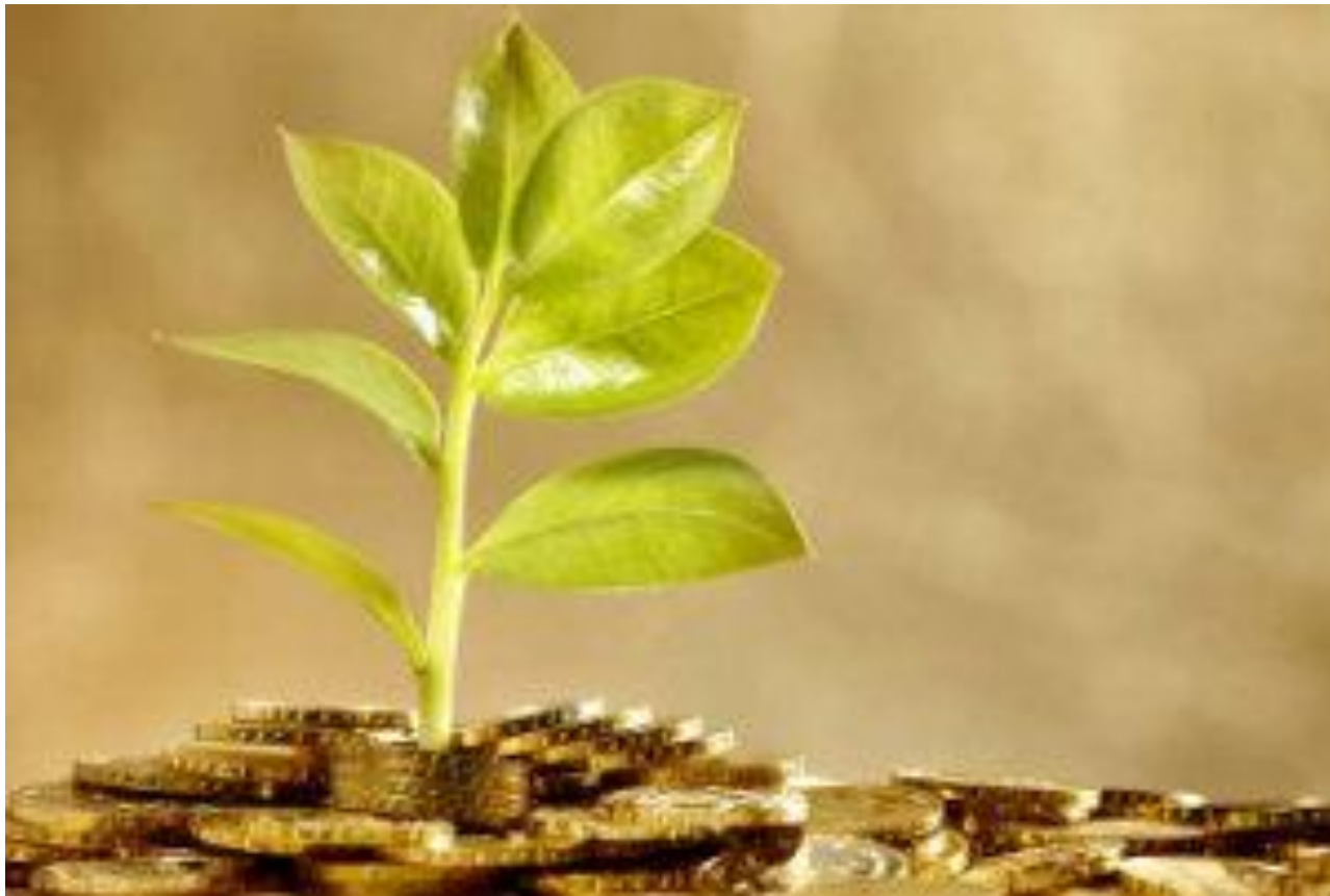
ATNC Cascavel - PR